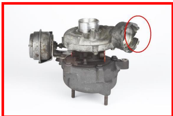
Figura 5 – Carcasa rupta