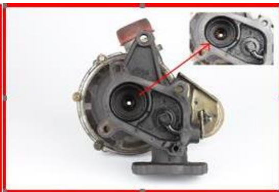
Figura 4 – Lipsa ax