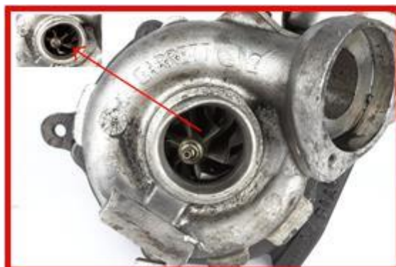
Figura 3 - Carcasa (melc) deteriorata