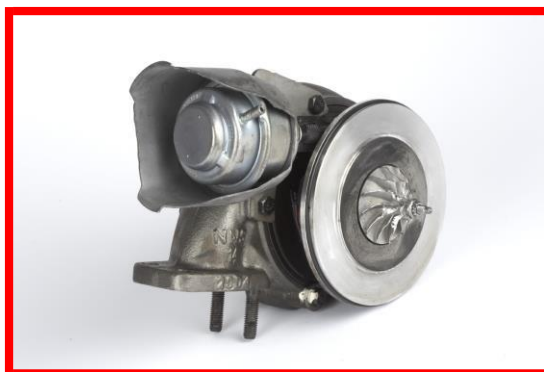
Figura 1 – Turbosuflyanta incompleta