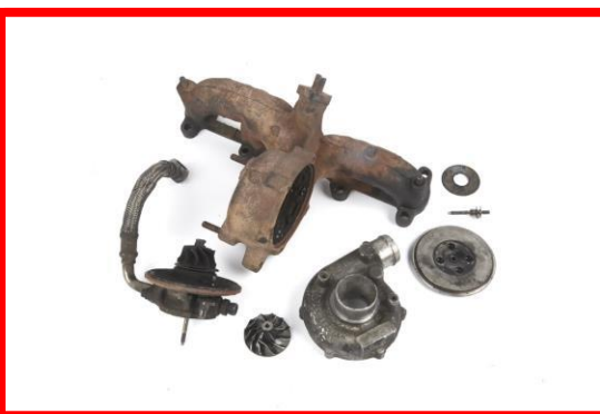
Figura 2 – Turbosuflyanta dezasamblata